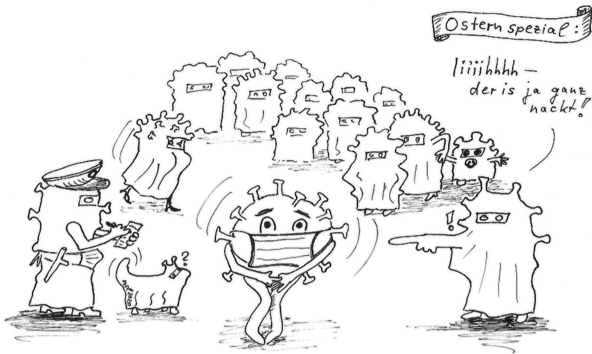
Zeichnung: Nikola Schröder-Liefing, www.medizinischer-yoga.eu

Für Politiker könnte man besonders fintenreich gleich ein kleines Mikrofon innen einbauen. Das könnte man dann, je nach Politiker, anschalten oder nicht. Letzteres vor allem bei solchen, deren Kommentar man nicht hören will. Wenn sie dann öffentlich kommentieren wollen, könnte man das Mikrofon mit einer Lautsprecheranlage verbinden. Sobald sie dummes Zeug reden, würde man den Ton einfach abschalten. Das wäre dann noch ein praktischer Nebeneffekt.