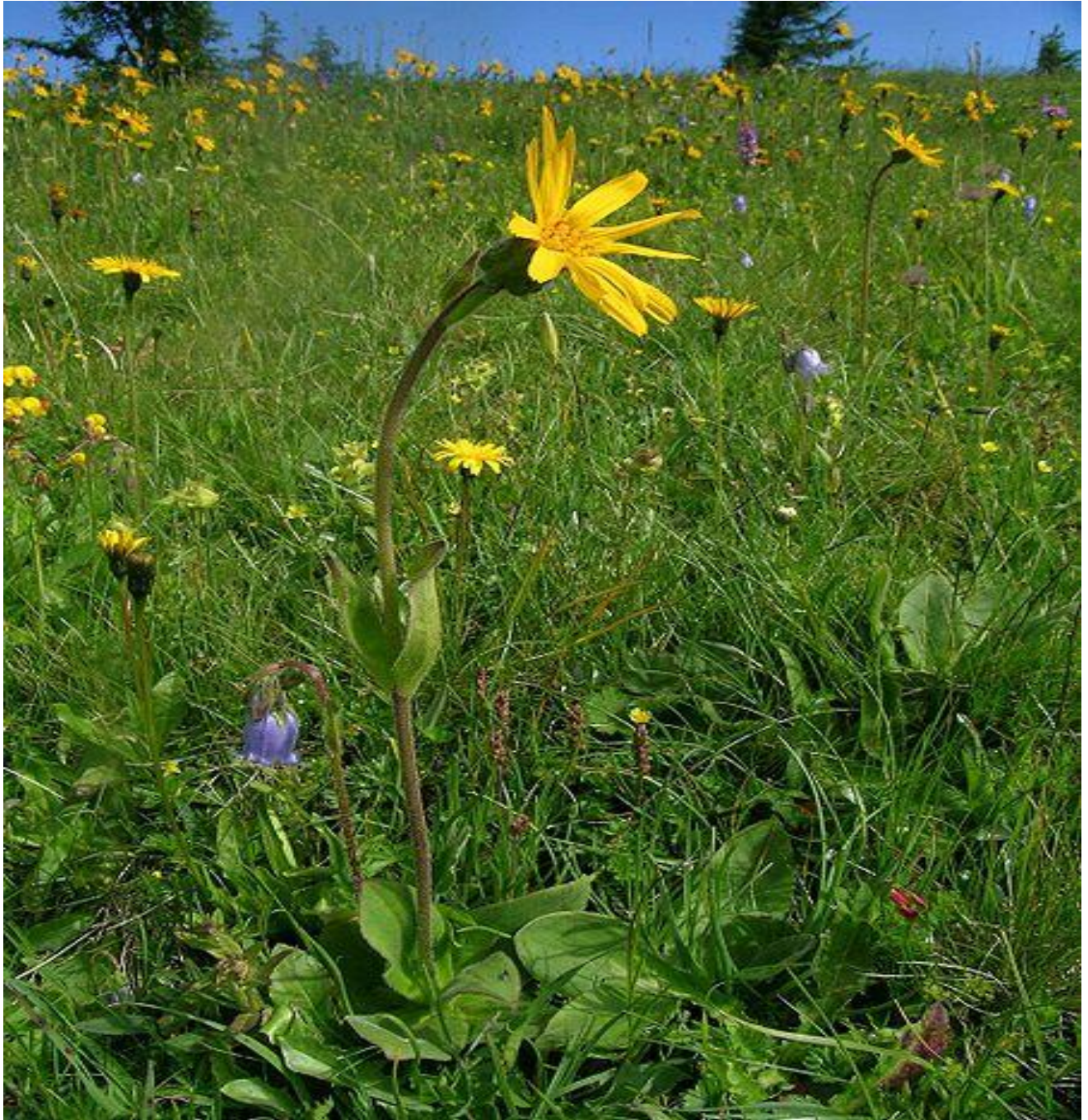
Abbildung 2 – Arnica montana

Arnika ist eine alte Heilpflanze. Man nennt sie auch das „Fallkraut“ oder das „Bergwohlverleih“. In alten Tinkturen zum Einreiben bei Schmerzen kommt es oft als Auszug vor, obwohl eine äußere Anwendung in der Regel nicht günstig ist, weil sie Hautreizungen verursachen kann. Arnica wächst in den Bergen, auf Höhen zwischen 800 und 1400 m etwa, je nach Klima. Ich habe sie dort bei Bergwanderungen des Öfteren gesehen, nicht aber in tieferen Lagen.